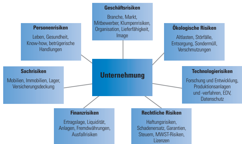
Mögliche Risikoarten im Unternehmen